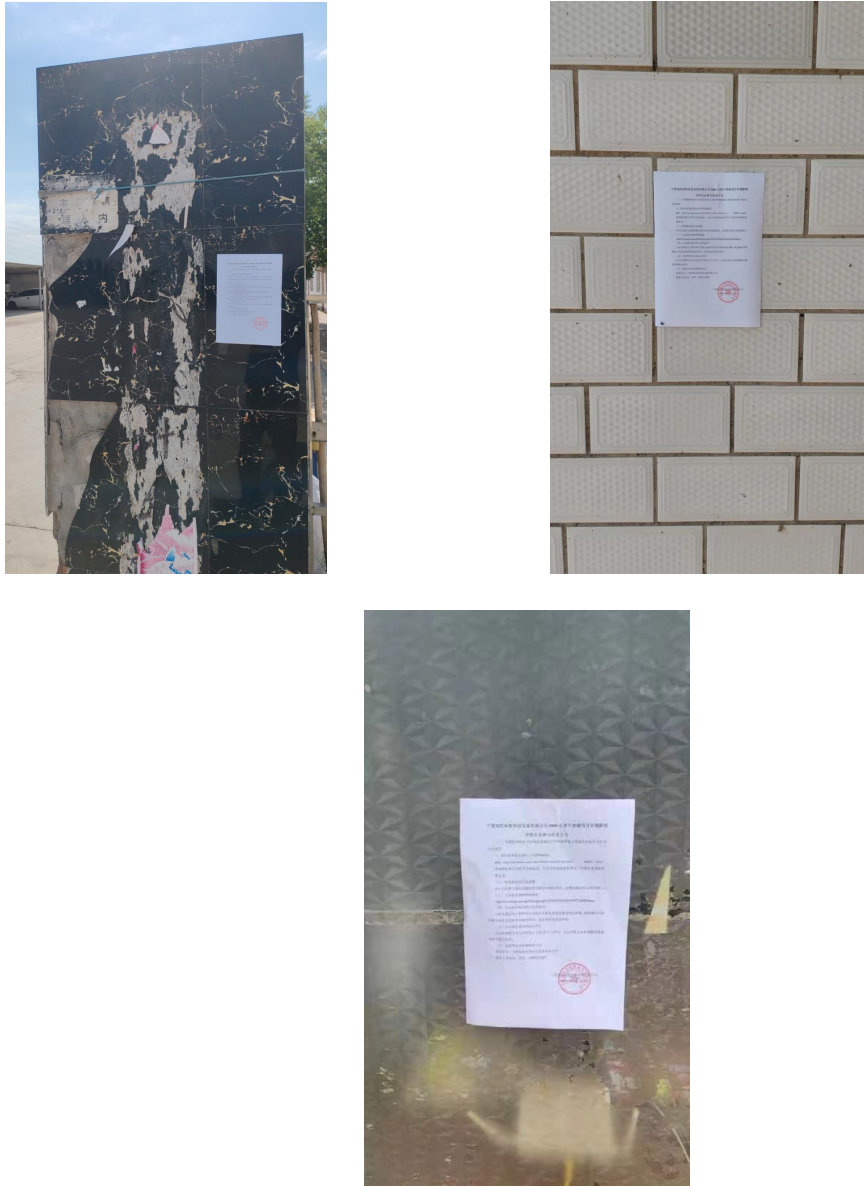
图 3-1 项目张贴公示照片