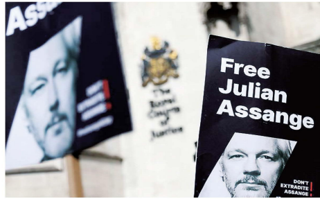
这是3月26日在位于伦敦的英国高等法院外拍摄的写有“释放阿桑奇”的标语牌。

当地时间6月24日，“维基揭秘”网站创始人朱利安·阿桑奇从英国监狱获释。据报道，他已与美国方面达成认罪协议，将在完成必要法庭程序后返回原籍国澳大利亚。阿桑奇与美方达成了什么样的认罪协议？美国缘何突然同意“放手”？这一事件走向如何？